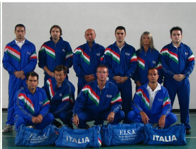
I partecipanti all'Embukai del Nord Italia.