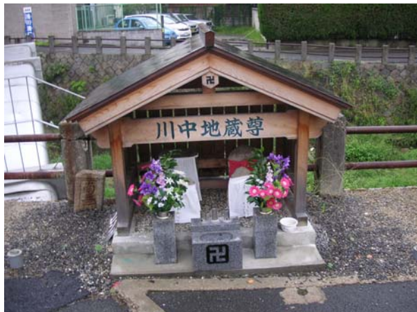
Piccolo tempio Nara