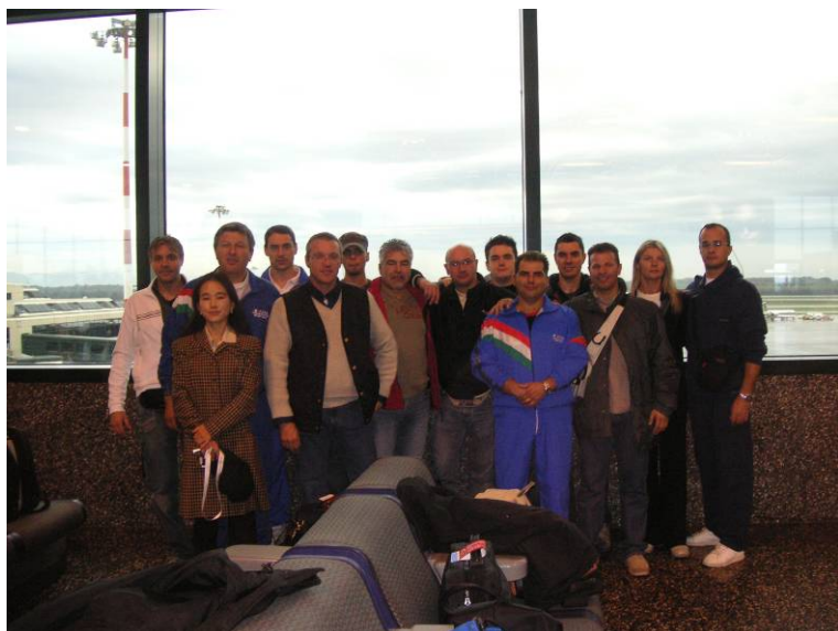
Partenza da Milano-Malpensa