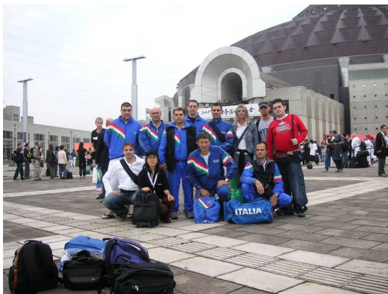
Foto al Sundome .